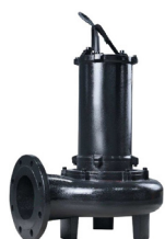
Pompa Angkat Pemurnian Air

Air limbah terlebih dahulu masuk ke tangki seleksi biologis untuk proses pencampuran awal dan pembentukan mikroorganisme aktif. Selanjutnya air dialirkan ke tangki anoksik dan tangki aerob untuk proses penguraian bahan organik serta penghilangan nitrogen. Pada tahap akhir, air masuk ke tangki sedimentasi untuk memisahkan lumpur dan air olahan, sementara sebagian lumpur dikembalikan ke proses awal untuk menjaga kestabilan sistem.