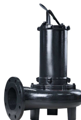
Pompa Angkat Mikrofiltrasi