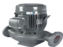
Pengembalian Lumpur (Sludge Return)