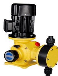
Pompa Dosing Desinfeksi