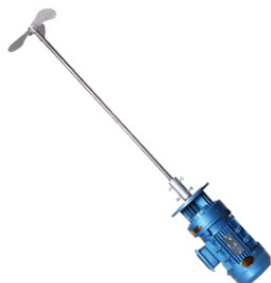
Pompa Angkat Pemurnian Air

Fungsi: Penambahan natrium hipoklorit untuk menonaktifkan patogen.