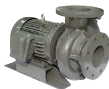
Pengembalian Cairan Campuran