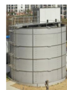
Tangki Pemurnian Air